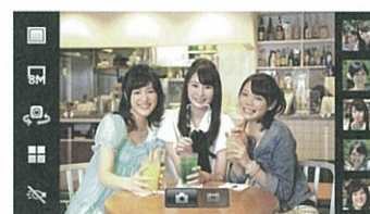
16倍デジタルズーム