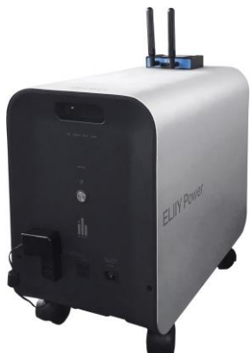
POWER YILLE 3 (パワーイレ・スリー)