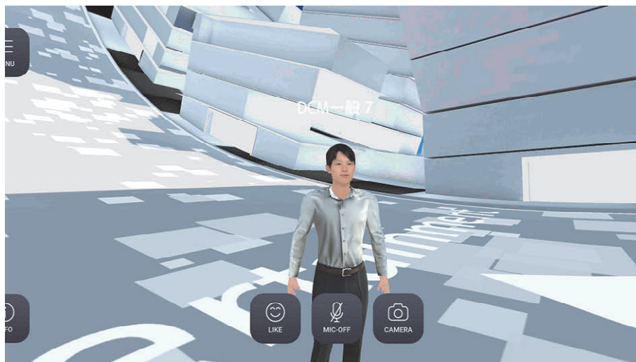
図4 Virtual Booth

場感のある限定コンテンツをスマートフォンアプリにより配信した（図5）。本技術は、専用の機材を用いてあらゆる角度から撮影した人や物の3DモデルをVR空間にそのまま再現するだけでなく、被写