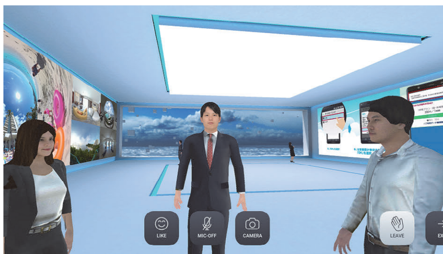
図5 Virtual Booth内基本ブースの様様