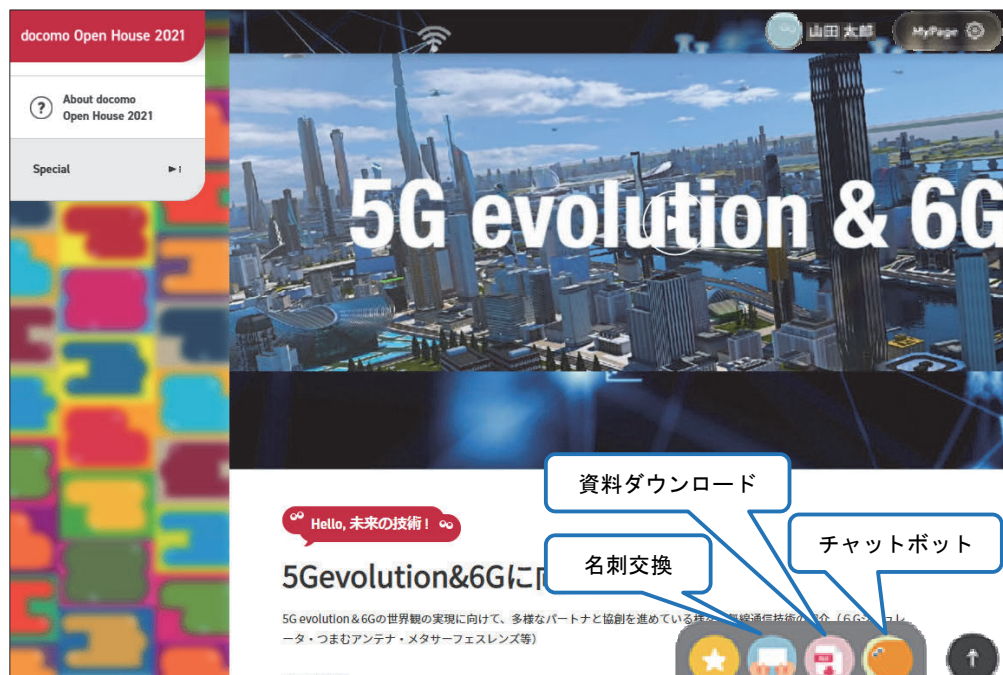
図2 docomo Open House 2021 Tech Showcase