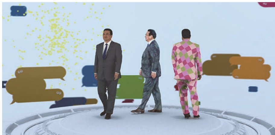
図3 ウェルカムスピーチ