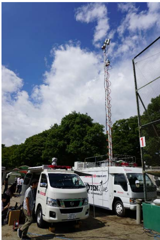
図2 実証実験風景(左:MEC搭載車両、右:移動基地局車)