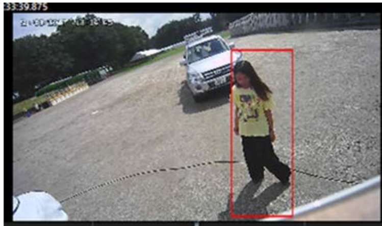
図4-1 衣服の色による人物検知