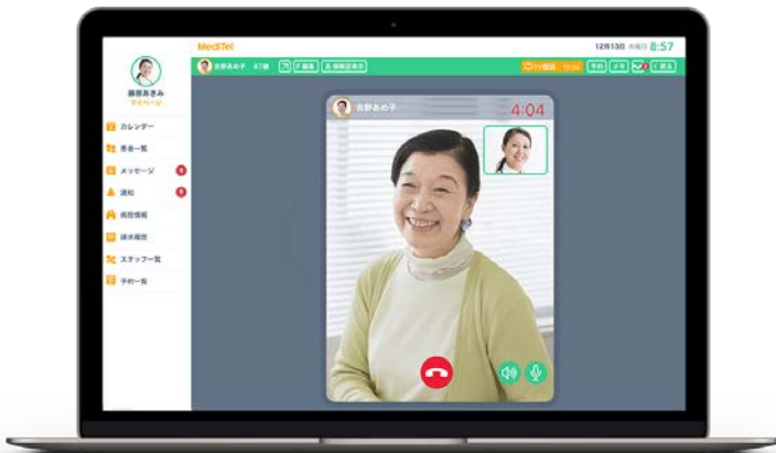
医師がオンライン診療をする際の画面イメージ

現役医師との共同開発により、マニュアルを見なくても分かるシンプルで直感的なサービスを実現しました。