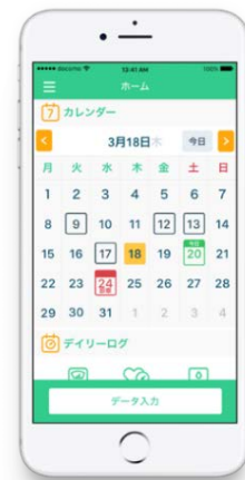
患者さまが診療予約をする際の画面イメージ