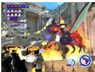
ヴィーナスフォートを舞台としたゲーム体験

なお、ヴィーナスフォートにご来館の一般のお客様を対象とした体験イベントも実施します。