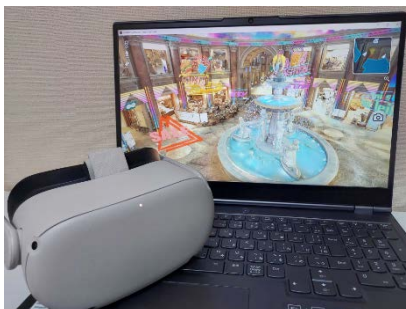
精巧なデジタルツインで遠隔地から参加