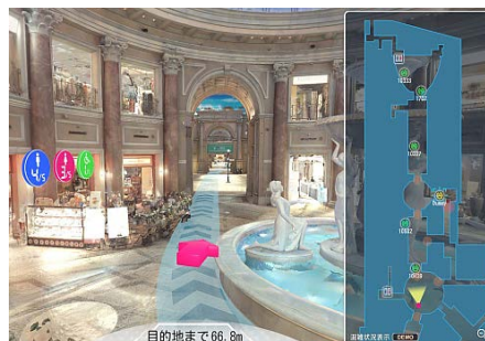
混雑状況や位置情報をリアルタイムで可視化

森ビルとドコモは、本実証実験を通じて得られるさまざまな知見を活用しながら、リアルとデジタルの実用的な融合を模索し、より便利で豊かな都市空間の実現をめざしてまいります。