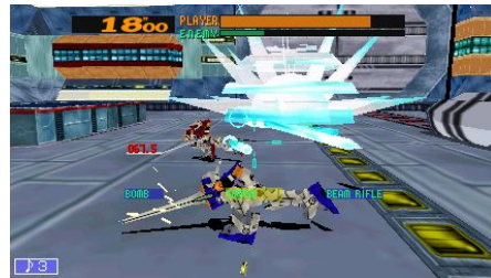
CHARACTER DESIGN:KATOKI HAJIME