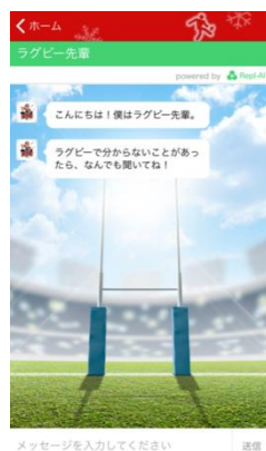
チャットボット機能