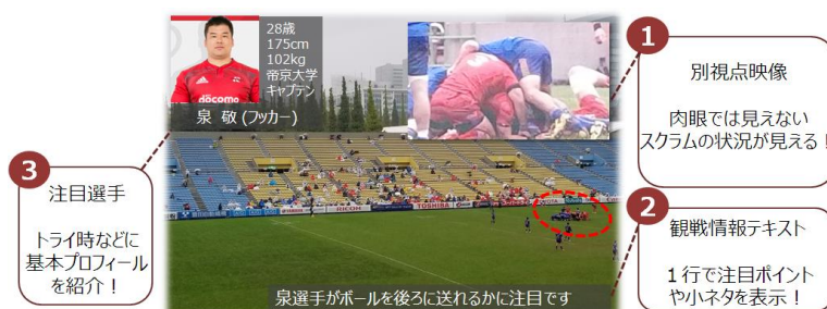
<スマートグラス上のイメージ>