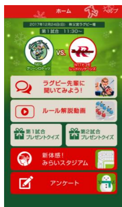
アプリトップ画面