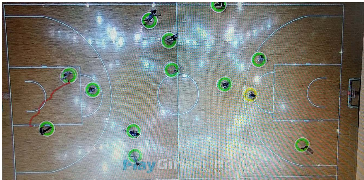
図1: 選手・背番号を認識してトラッキング