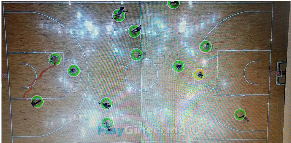
図1: 選手・背番号を認識してトラッキング