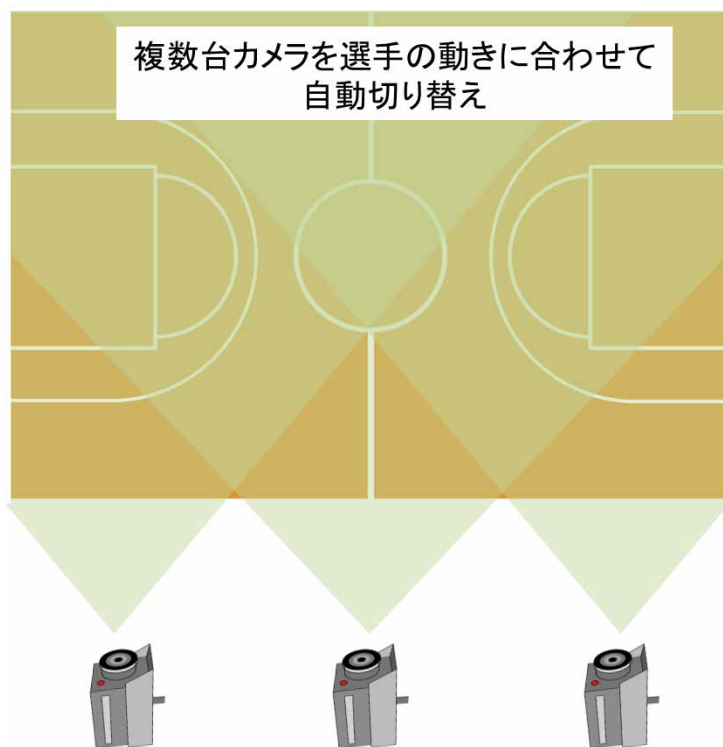
図3:複数台カメラ切り替えイメージ