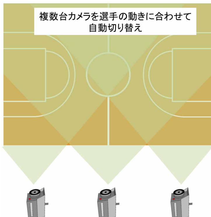
図3: 複数台カメラ切り替えイメージ