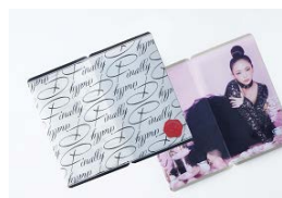
マスクケースセット