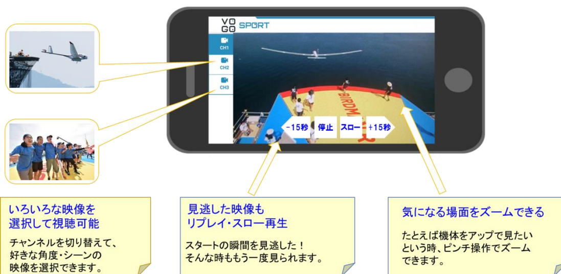
<5Gを活用した多視点視聴のイメージ>

ドコモは、5Gにおいて、幅広いパートナーと共に新たな利用シーン創出に向けた取り組みを拡大するため「ドコモ5Gオープンパートナープログラム」を、2018年2月より提供しており、参画頂いている企業・団体(約1,800団体※2)に対し、5Gの技術や仕様に関する情報や、パートナー間の意見交換を行うワークショップの場を提供しています。読売テレビも、本プログラムに参画しています。