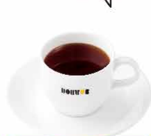
ブレンドコーヒー