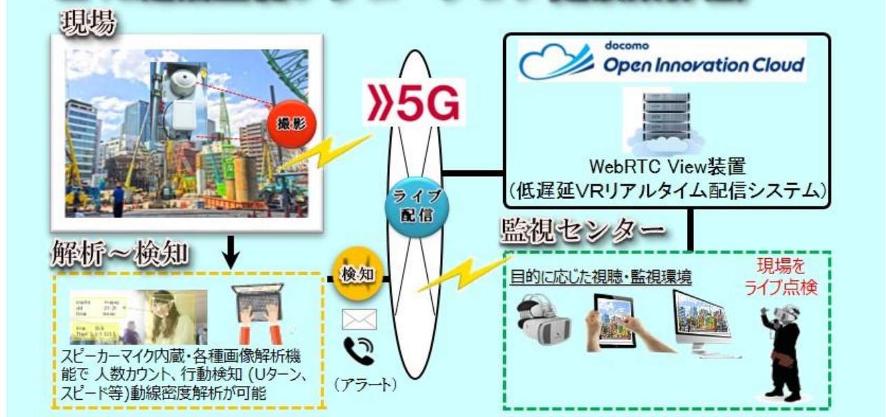
(本ソリューションの利用イメージ図)

本ソリューションを2020年1月23日(木)から1月24日(金)まで東京ビッグサイトで開催するドコモのイベント「DOCOMO Open House 2020」に展示します。