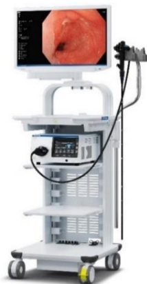
内視鏡システム「EVIS X1」 (システムセット例)

「EVIS X1」は、オリンパス独自の技術の搭載に加え、従来機である「EVIS LUCERA ELITE」と「EVIS EXERA III」の、それぞれ異なるスコープラインアップとの互換性も確保しています。これにより幅広いラインアップのスコープをお使いいただけ、内視鏡による診断・治療の可能性拡大に貢献します。