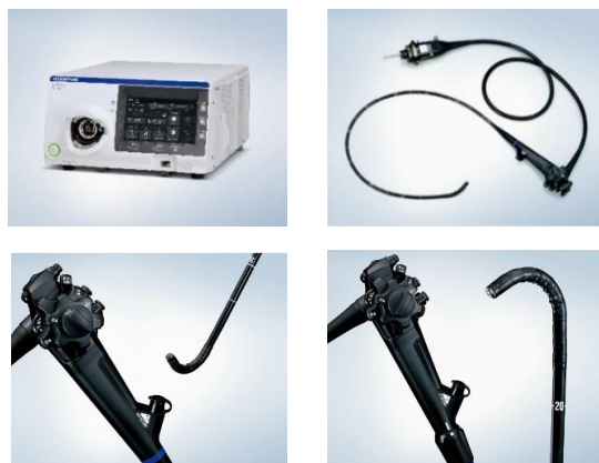
(左上) EVIS X1 ビデオシステムセンター OLYMPUS CV-1500 (右上) 上部消化管汎用ビデオスコープ OLYMPUS GIF-EZ1500 (左下) 上部消化管汎用ビデオスコープ OLYMPUS GIF-XZ1200 (右下) 大腸汎用ビデオスコープ OLYMPUS CF-XZ1200 シリーズ