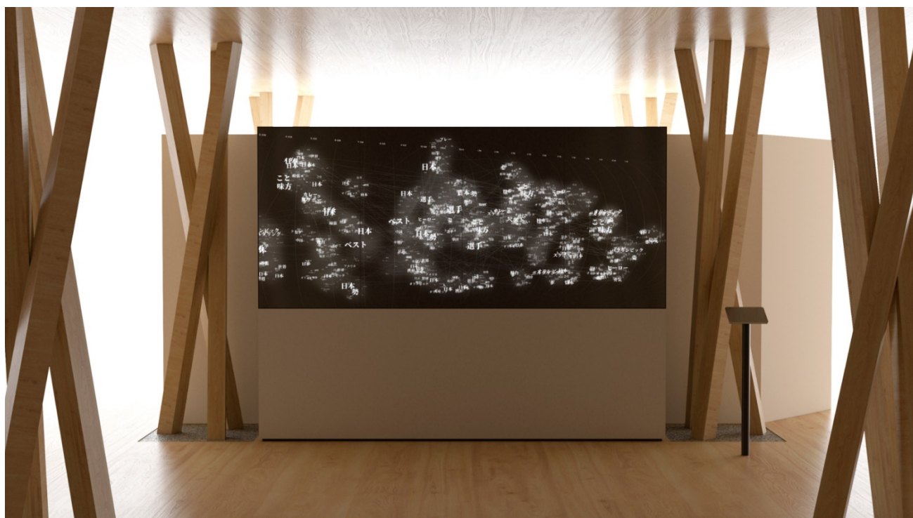
みえる応援電話ディスプレイ(イメージ)

選手は日本中から集まった大会への応援や想いを文字として受け取ることができるほか、臨場感たっぷりの録音音声メッセージ(日本語)をヘッドフォンで聞くことも可能です。また、ディスプレイに装備された動作センサーにより、応援している方々は選手のメッセージ観覧数を「みえる応援電話」特設サイトを介して確認することもできるため、相互での繋がりを感ずることも期待できます。