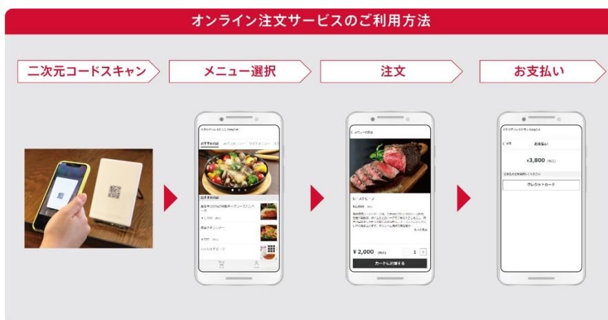
オンライン注文サービス利用案内パネル(イメージイラスト)

手元のスマートフォンからキャッシュレスで注文できるため、接触機会や密集する頻度を減らすことができ、感染症対策に効果があるほか、混雑を避けることで選手のストレスを軽減することができます。