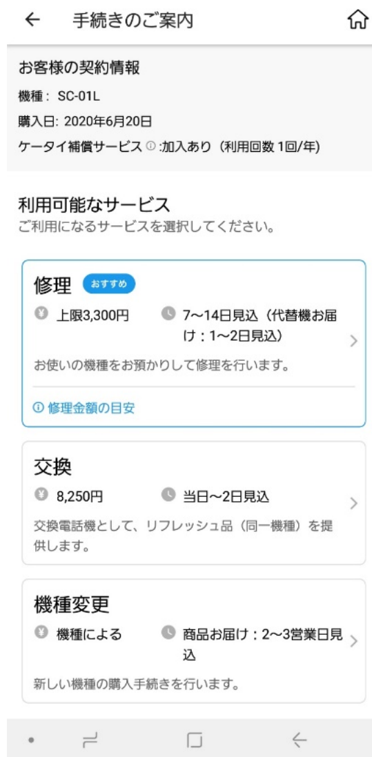
<手続きのご案内 画面イメージ>

株式会社NTTドコモ(以下、ドコモ)は、お客さまがご自身でスマートフォンやタブレットの故障診断を行うことができるほか、その後のWEB修理受け付けやドコモショップの来店予約手続きまでをワンストップでご案内するアプリ「スマホ診断 online™」に、新たに「dアカウント®」と連携することで、お客さまの「ケータイ補償サービス」の加入状況やご利用状況に基づき、故障端末の本体交換金額や修理金額の目安および、おすすめの手続き*をご案内する機能を追加しました。新たに追加された機能は、2021年7月29日(木)から提供を開始します。