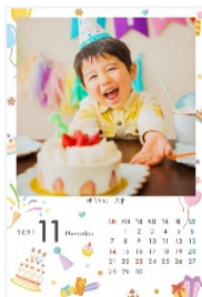
こよみフォト(カレンダーあり)