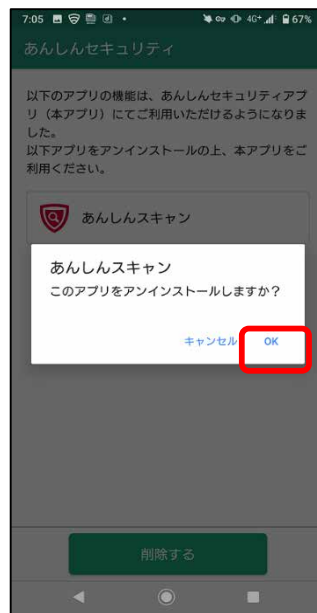
アンインストール同意画面

あんしんスキャンアプリをインストールしている場合は、アンインストールを促す画面が表示される。 ※「あんしんナンバーチェックアプリ」がインストール済の場合、併記されます。