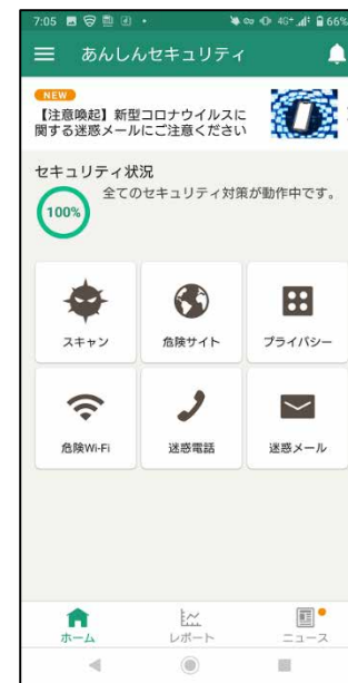
設定完了画面 (契約済の場合)

あんしんセキュリティを契約済の場合、上記の画面が表示され、セキュリティ状況が100%になれば完了です。