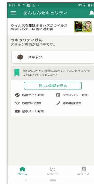
設定完了画面 (未契約の場合)

あんしんセキュリティを契約済の場合、上記の画面が表示され、セキュリティ状況が100%になれば完了です。