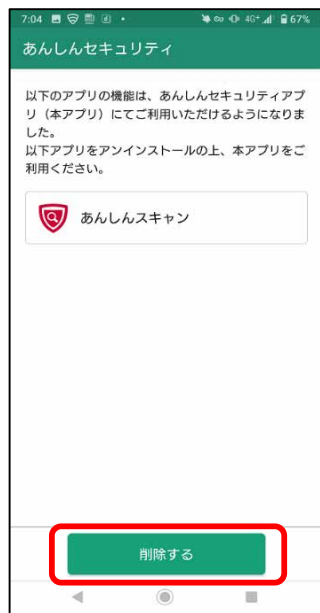
アンインストール案内画面

あんしんスキャンアプリをインストールしている場合は、アンインストールを促す画面が表示される。 ※「あんしんナンバーチェックアプリ」がインストール済の場合、併記されます。