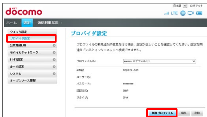
③プロファイルの追加

「プロバイダ設定」をクリックします。 右下の「新規プロファイル」をクリックします。