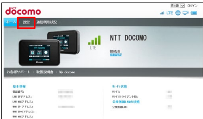
①ホーム画面の表示