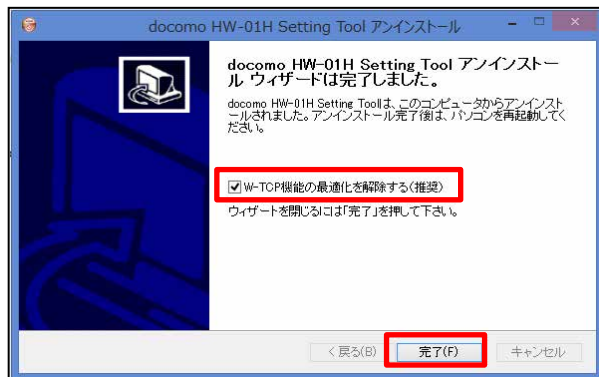
⑨アンインストールウィザードの完了

「W-TCP機能の最適化を解除する（推奨）」にチェックボックスにチェックが入っているのを確認し、「完了」をクリックします。再起動をします。