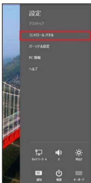
③コントロールパネルを開く