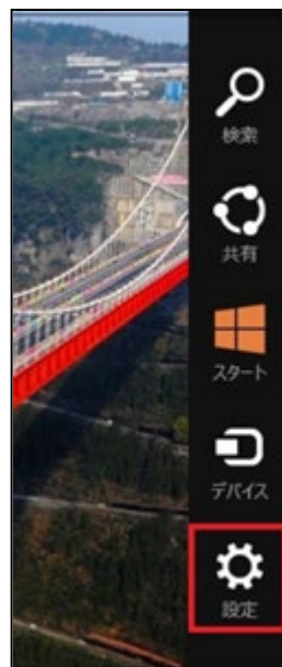
②設定メニューを開く