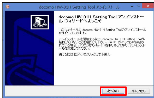
⑦アンインストールウィザード起動

プログラムの一覧から「docomo HW-01H Setting Tool」をクリックし選択します。「アンインストール」をクリックします。 ※ユーザー アカウント制御の画面が表示される場合があります。「はい」をクリックして進んでください。