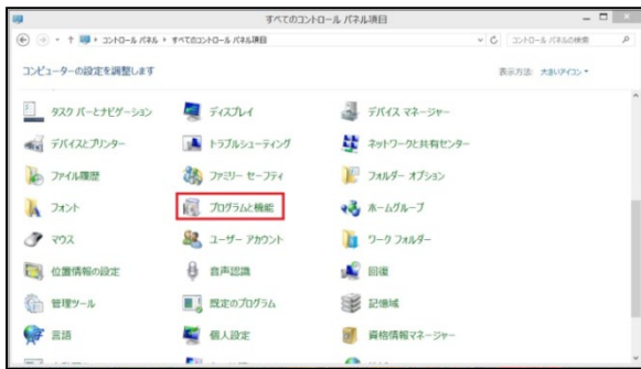
⑤プログラムの追加と削除（「大きいアイコン / 小さいアイコン表示」の場合）