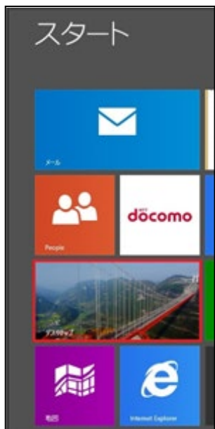
①デスクトップを開く