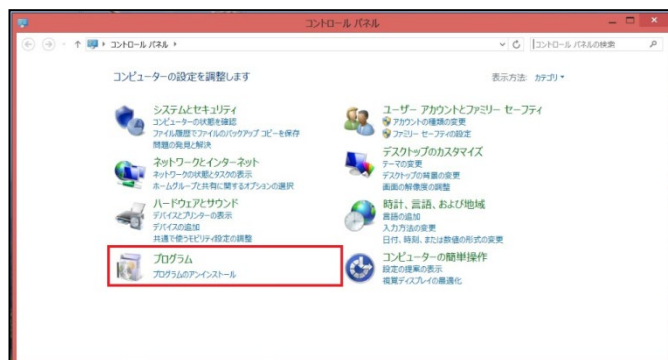
④「プログラムのアンインストール」を選択（カテゴリ表示の場合）