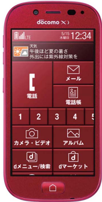
らくらくスマートフォン3