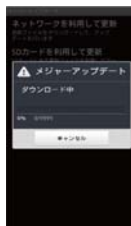
⑥ファイル確認後「OK」をタップ 更新ソフトウェアのダウンロードが開始されます。