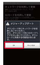
⑤さらに「OK」をタップ 更新情報の取得を行います。