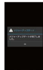
⑨バージョンアップ終了後、電源が再起動しバージョンアップ完了となります。

※「Android」はGoogle Inc.の商標または登録商標です。※「Google」はGoogle Inc.の商標または登録商標です。※「Wi-Fi」は、Wi-Fi Allianceの登録商標です。