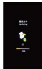
⑧電源再起動後、バージョンアップがスタートします。 (所要時間:約10分)