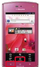
①ホーム画面で「メニュー」→「本体設定」→「端末情報」をタップ

*「docomo Wi-Fi」とは、駅、空港、カフェ、ファストフードなどで、無線による最大54Mbpsの高速大容量インターネットアクセスを可能とするNTTドコモが提供する公衆無線LANサービスです。ドコモの携帯電話のご契約者は、パソコン(My docomo)・iモード・spモードでお申込み後、即時ご利用可能です。詳細はドコモホームページをご確認ください。(http://www.nttdocomo.co.jp/service/data/docomo_wifi/)