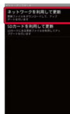
③「ネットワークを利用して更新」をタップ