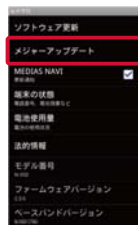
②「メジャーアップデート」→「更新を開始する」をタップ