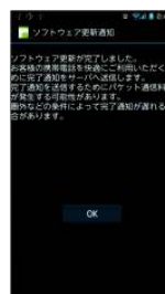
⑧「OK」をタップ OSバージョンアップ完了です。

※「Android」はGoogle Inc.の商標または登録商標です。※「Google」はGoogle Inc.の商標または登録商標です。※「Wi-Fi」は、Wi-Fi Allianceの登録商標です。