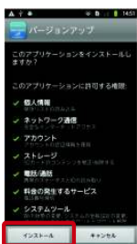
②「インストール」をタップ