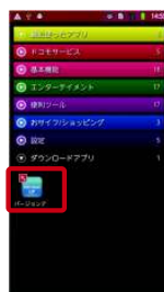
④アプリケーションメニューで「バージョンアップ」⇒「バージョンアップを開始する」をタップ