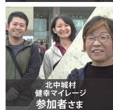
北中城村 健康マイレージ 参加者さま