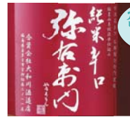
純米辛口弥右衛門