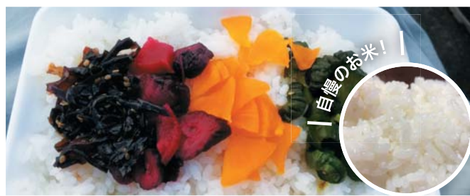
白ごはんとお漬物

日本有数の牡蠣の名産地・宮城は東松島から、豊かな海でギュッと身を引き締めて育ったミルクィで濃厚な牡蠣が到着。地元漁師がおいしく蒸し上げます!