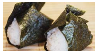
自然栽培米おにぎり

猪苗代町産の自然栽培米を使った手作りおにぎり。海苔には宮城県東松島市の皇室献上の浜で採れたおにぎり用の特別海苔を用いました。鮭、梅、昆布、塩の4種を提供します!