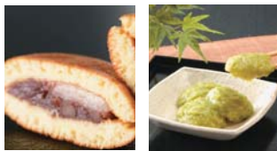
餅入り小倉どら焼

創業70年の老舗・こだまの看板商品「餅入り小倉どら焼」のおやつサイズや、宮城県産もち米と枝豆を使った菅野食品の「ずんだ餅」などの美味をご用意!