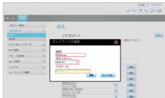
② 赤枠内の設定を行い「接続」をタップします。