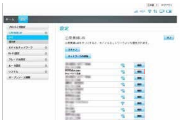
③ サービスエリア内で [公衆無線LAN] 画面より、ご利用のサービスのSSIDの「接続」をクリックします。