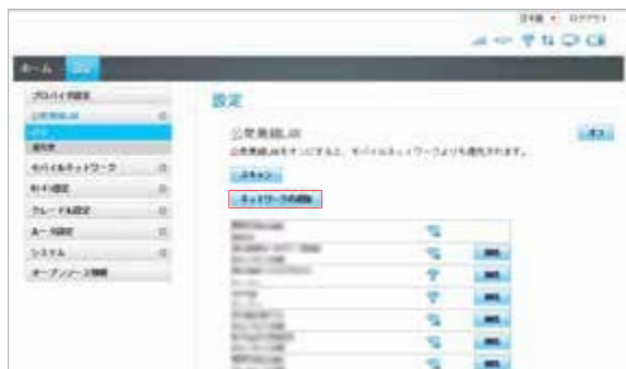
① [公衆無線LAN] 画面より「ネットワークの追加」をクリックします。