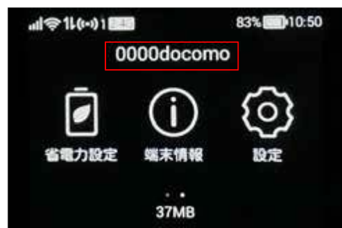
④ 接続・認証に成功すると、HW-01L設定ツールの設定画面やホーム画面、端末のホーム画面に接続先が表示されます。